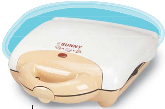
■ SSM - 800 650 w