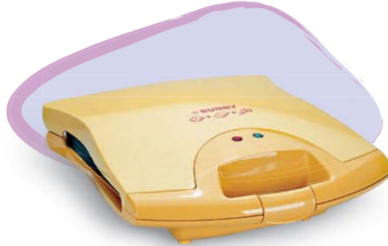
■ SSM - 650 650 w