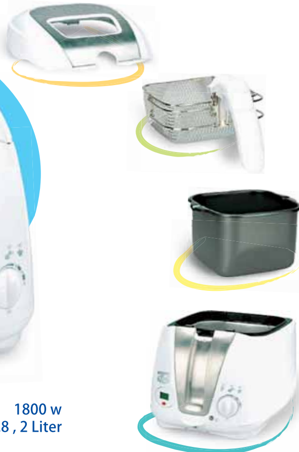
■ SDF - 2350 1800 w 1.8 , 2 Liter