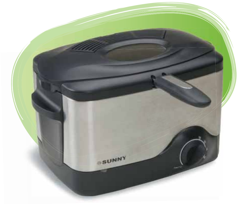
■ MINI SDF - 1320 1200 w 1, 1.3 Liter