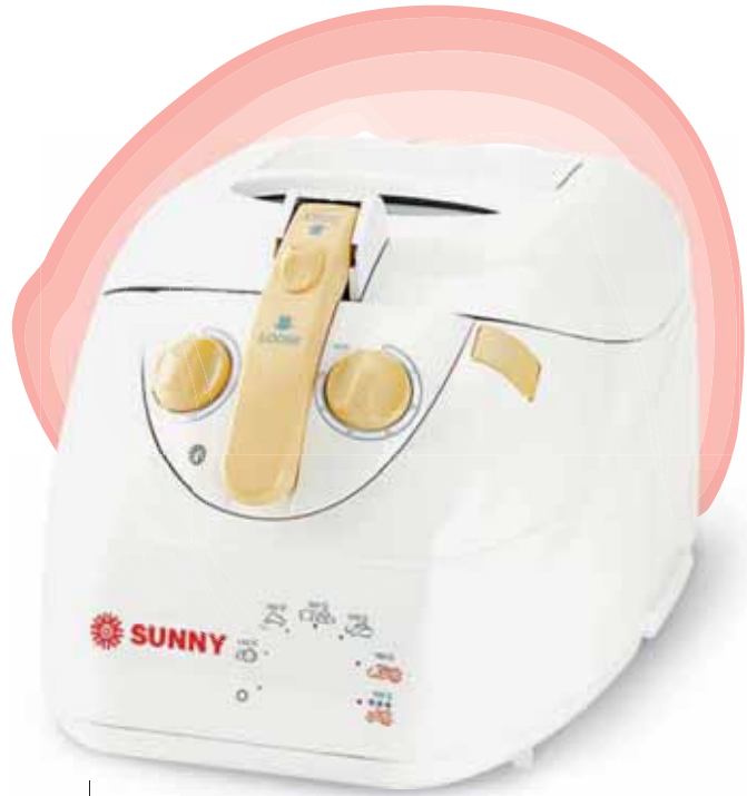
■ SDF - 2300 2300 w 1.8 , 2.3 Liter