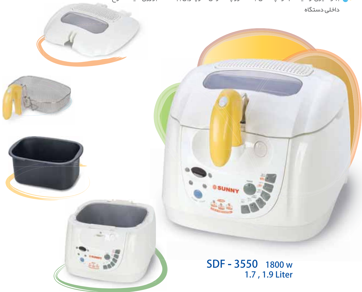
SDF - 3550 1800 w 1.7 , 1.9 Liter