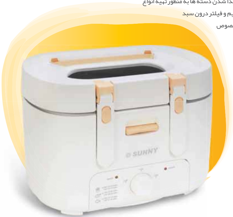
SDF - 2470 1850 , 2000 w 2.0 , 2.5 Liter