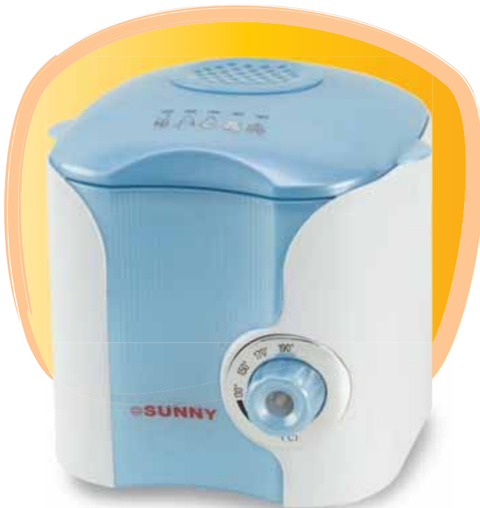
■ MINI SDF - 220 750 w 0.6, 0.7 Liter