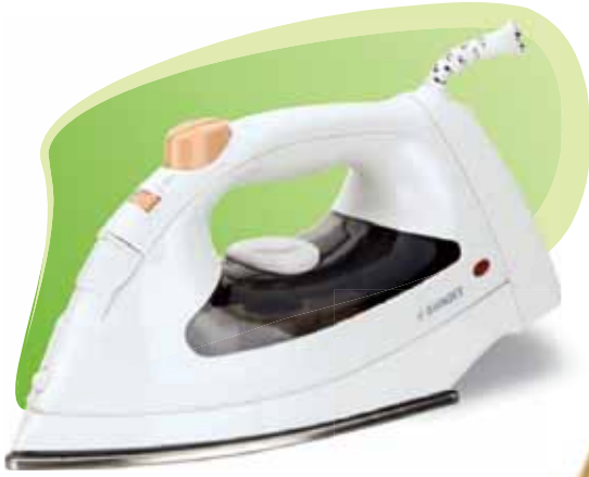
■ SI - 710 1600 w