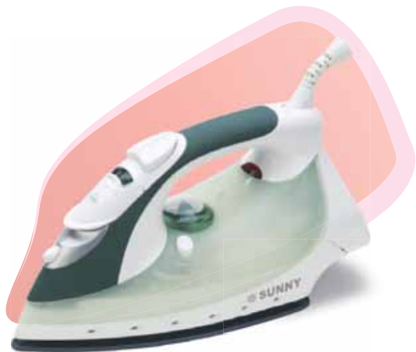
■ SI - 860 1800 w