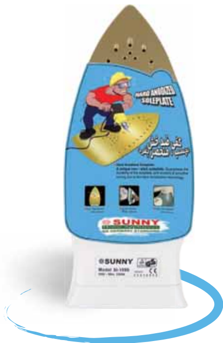
■ SI-1080 2200 w