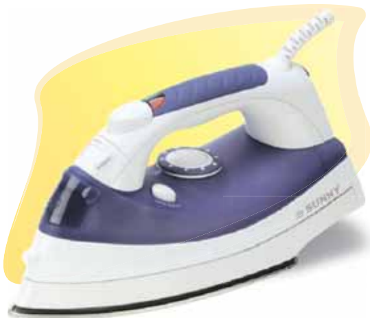
■ SI - 840 2000 w