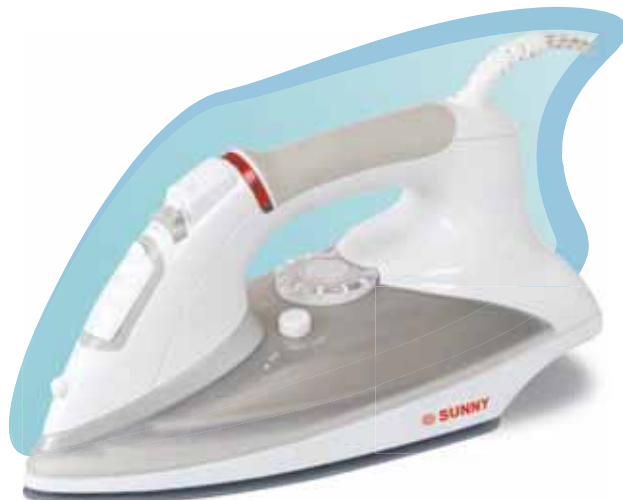
■ SI - 990 2000 w