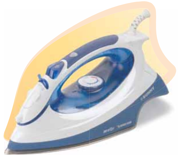
■ SI - 910 2200 w