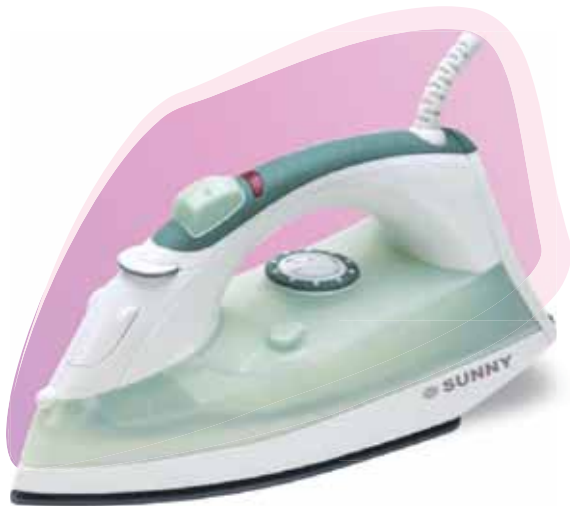
■ SI - 880 2000 w