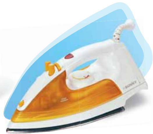
■ SI - 810 1500 w